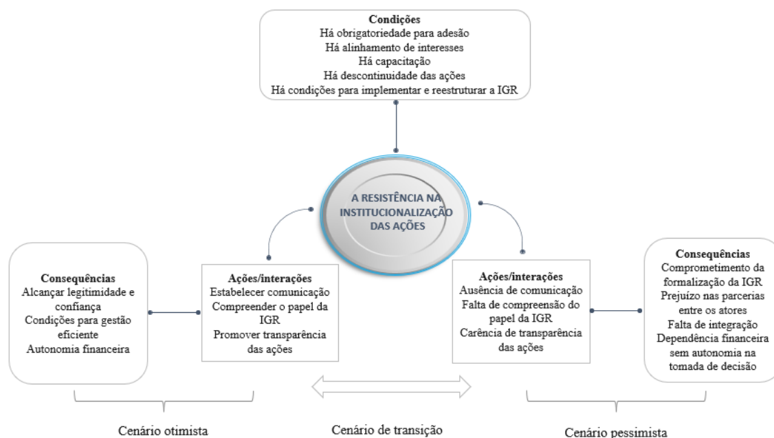
Figura 3 – Modelo pragmático com os componentes da teoria para definir o contexto