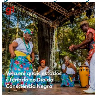
Figura 1 – Postagem Instagram

publicada no Instagram, surgem diversos comentários, ora a favor, ora contrários à data e ao seu reconhecimento.