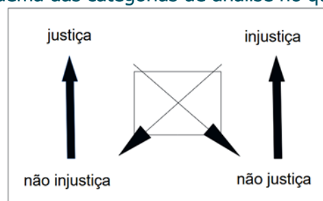
Figura 1 – Esquema das categorias de análise no quadrado semiótico

O modelo do quadrado semiótico representa essas relações na Figura 1: