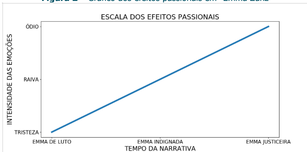
Figura 2 – Gráfico dos efeitos passionais em “Emma Zunz”

Os efeitos passionais do conto estão sintetizados no gráfico da Figura 2, a seguir: