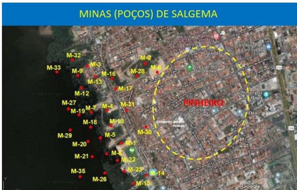
Imagem 2 – Minas/Poços do minério sal-gema

Isso comprometeu, ao longo dos anos de exploração, a estrutura das residências e das vias dos bairros, a segurança dos moradores e, sobretudo, provoca mais medo e adoecimento, sob o discurso de que aquela região ia afundar, como mostra a Imagem 2.