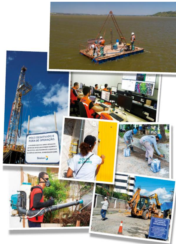
Imagem 7 – Recorte das imagens do Informe Publicitário nº 1