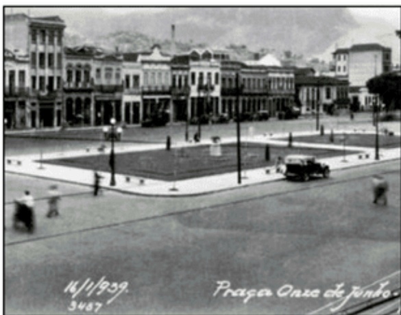
Fotografias 7 e 8 — Antiga Praça Onze & Atual Av. Presidente Vargas.

Assim como a Praça Onze, a alucinação de Andrade (2023, p. 12) é acometida por um banho de sangue que alcança a Avenida Rio Branco, perpendicular à Avenida Presidente Vargas, e denuncia, mais uma vez, que a reforma urbana não passou de uma ruptura traumática na história do Rio de Janeiro: “Milhares de cavalos brancos [...] carregando pajens também de branco, cetins e diamantes, surgem numa galopada imperial, ferindo gente, matando gente, gritos admiráveis de infelicidade”.