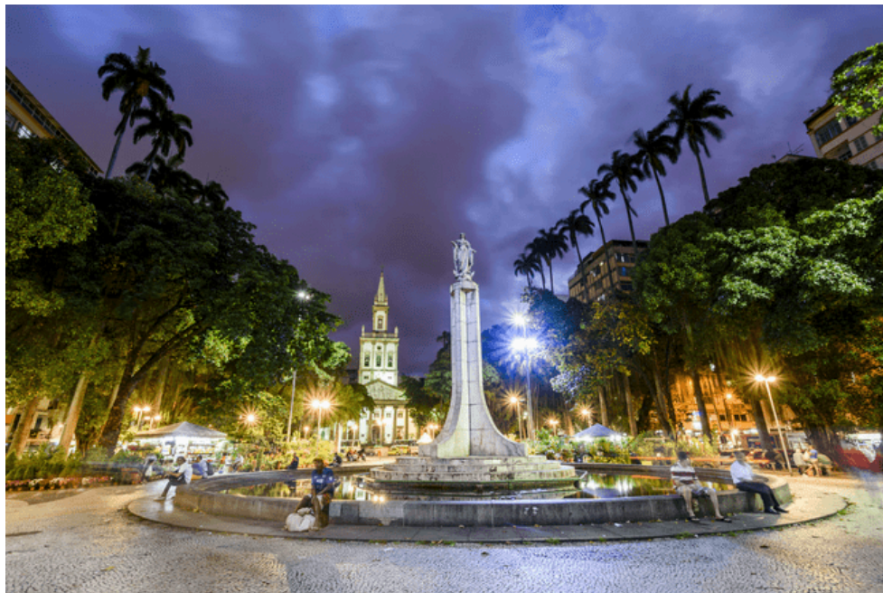
Fotografia 2 — Largo do Machado–RJ (2023).

local foi reformado e ressignificado como um patrimônio vivo através dos encontros dinâmicos e informais, tal como celebrado nas músicas populares brasileiras.