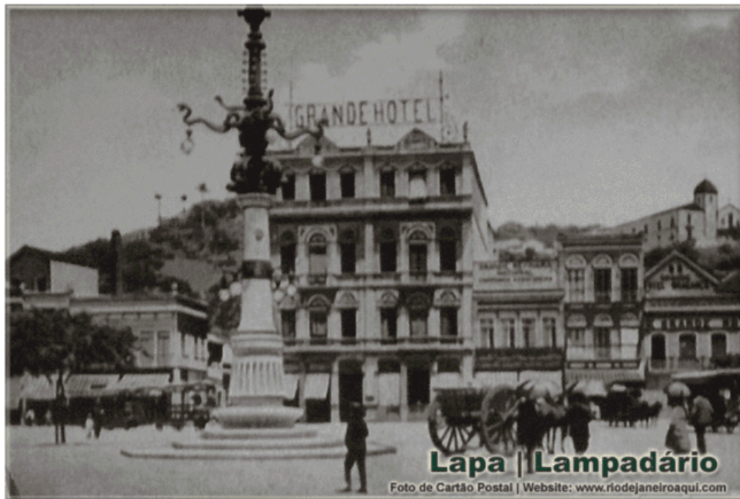
Fotografia 3 — Lampadário e Grande Hotel.

Meireles, inaugurada em 1965 após a demolição do Grande Hotel, criado para concorrer com o Hotel dos Estrangeiros , que ficava no bairro Catete.