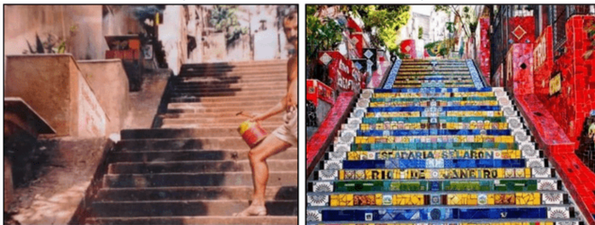
Fotografias 5 e 6 — Escadaria Selarón: antes e depois.