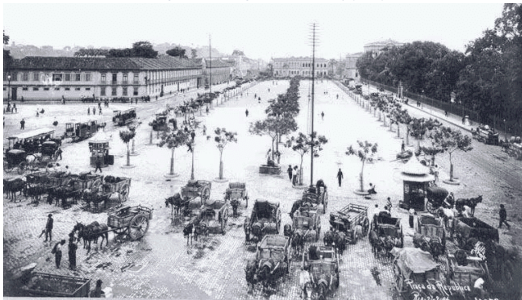
Fotografia 1 — Largo do Machado—RJ (1920).

O projeto de posicionar o Brasil como um país civilizado e moderno, no entanto, reflete uma identidade que não lhe pertence. Em consonância com isso, o Largo do Machado, localizado no bairro do Catete, é atualmente uma praça tradicional da cidade do Rio de Janeiro e um ponto de encontro repleto de galerias comerciais, bares, prédios históricos e manifestações culturais. Além disso, a praça foi um lugar de grande influência para composições musicais brasileiras, como Os Últimos Serão os Primeiros , da Banda BR-101, e Largo do Machado , dos cantores Chico Chico e Mantuano. As músicas revelam o espaço como uma potência simbólica de afetos, de encontros e de resistência à correria urbana e transformam-no em um cenário de liberdade e de poesia em que o cotidiano desacelera e as pessoas criam novas conexões. Tanto na primeira canção, “Então tá marcado: Largo do Machado / Eu te pago um chopp, cê me vê um trago” (BR-101, 2017, 42s), quanto na segunda: “Ontem, no Largo do Machado / Um café, um beijo e um abraço” (Chico Chico; Mantuano, 2025, 32s), as letras sugerem encontros informais que darão início a uma jornada por outros lugares da cidade. Ao passo que Mário de Andrade insere figuras europeias, como exemplo de diversidade e crítica, em lugares populares, as canções reforçam a potência simbólica do patrimônio nacional que busca uma ressignificação.