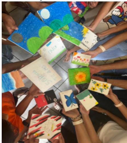
Figura 01: aplicação do método “arteterapia” com crianças e adolescentes do abrigo Mãe Rainha