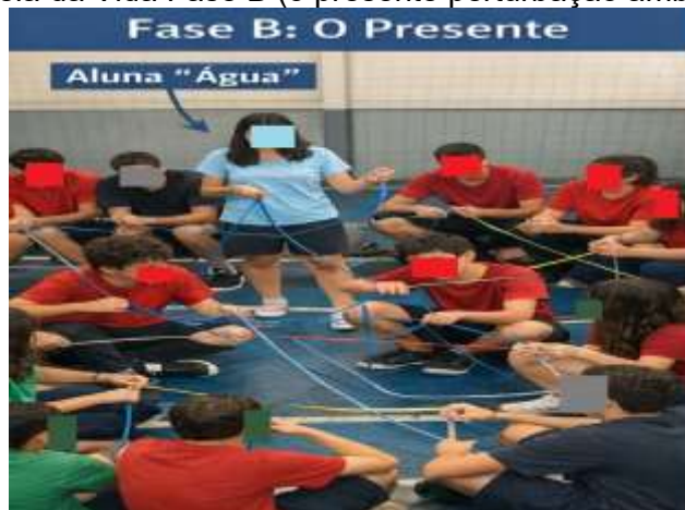
Figura 3 – 1 Teia da Vida Fase B (o presente perturbação ambiental simbólica)