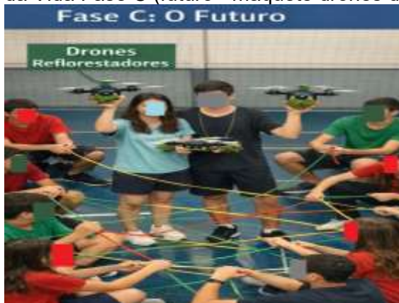
Figura 5 – 1 Teia da Vida Fase C (futuro - maquete drones de reflorestamento)