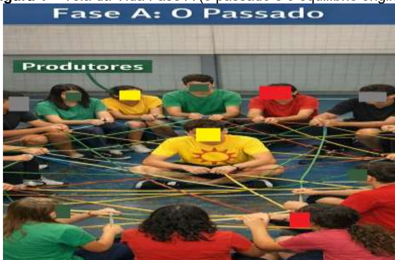
Figura 1 – Teia da Vida Fase A (o passado e o equilíbrio original)