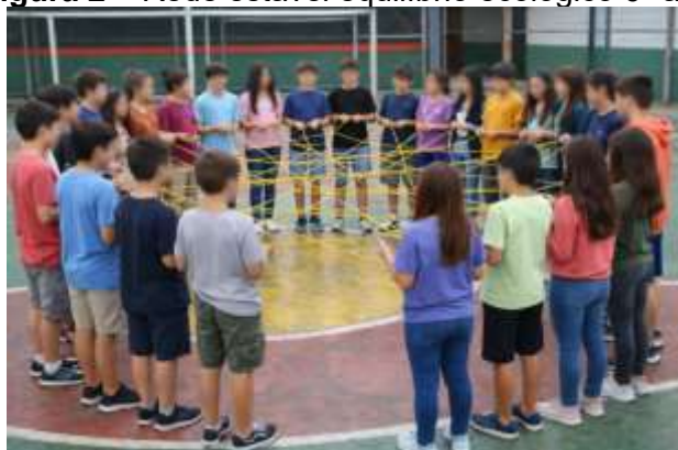
Figura 2 – Rede estável equilíbrio ecológico 6º ano