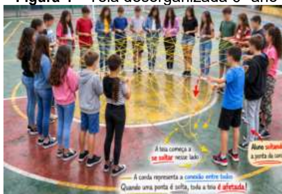
Figura 4 – Teia desorganizada 6º ano