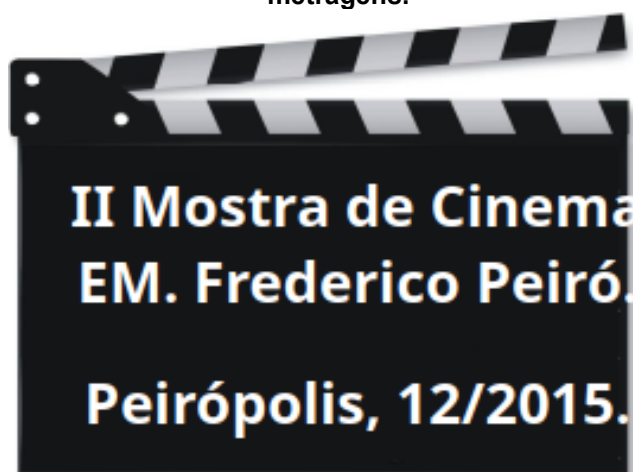
Figura 1: Convite enviado a comunidade escolar para participar da exibição dos curtas-metragens.

Foram produzidos sete curtas-metragens (um deles com a técnica do stop motion) e todos foram exibidos dentro e fora do ambiente escolar. A primeira exibição foi realizada na sala de cinema Urbano Salomão (Uberaba/MG) e teve como alvo o público universitário, alunos, funcionários e professores (Figura 2). A segunda aconteceu no auditório do Complexo Científico e Cultural de Peirópolis (Uberaba/MG) e contou com toda a comunidade escolar e alguns pais de alunos (Figura 2). Em ambas foi possível perceber um retorno bastante positivo pelo público, tanto pelos aplausos quanto pelos comentários ouvidos após a exibição, quando o elenco falava ao público e abria espaço para que este se manifestasse.