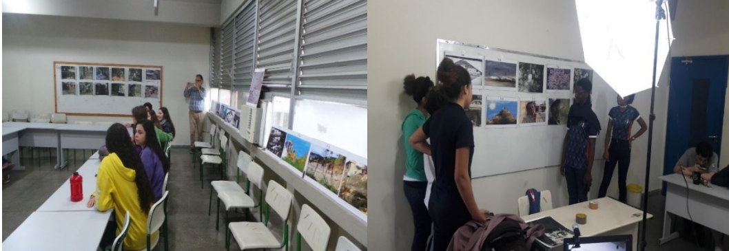
Figura 2a e 2b- Frames dispostos aleatoriamente ao redor da sala de aula e uma sequência de frames pronta ao fundo – CIEP 249 Brasil – França. Charitas – Niterói e Alunos apresentando uma narrativa a partir de frames selecionados pelos membros do grupo - CIEP 249 Brasil – França. Charitas – Niterói.

portanto, obedecendo-se uma ordem de grandeza de complexidade envolvida na realização das duas formas de análises imagéticas previstas na metodologia adotada para a execução da fase experimental da pesquisa.