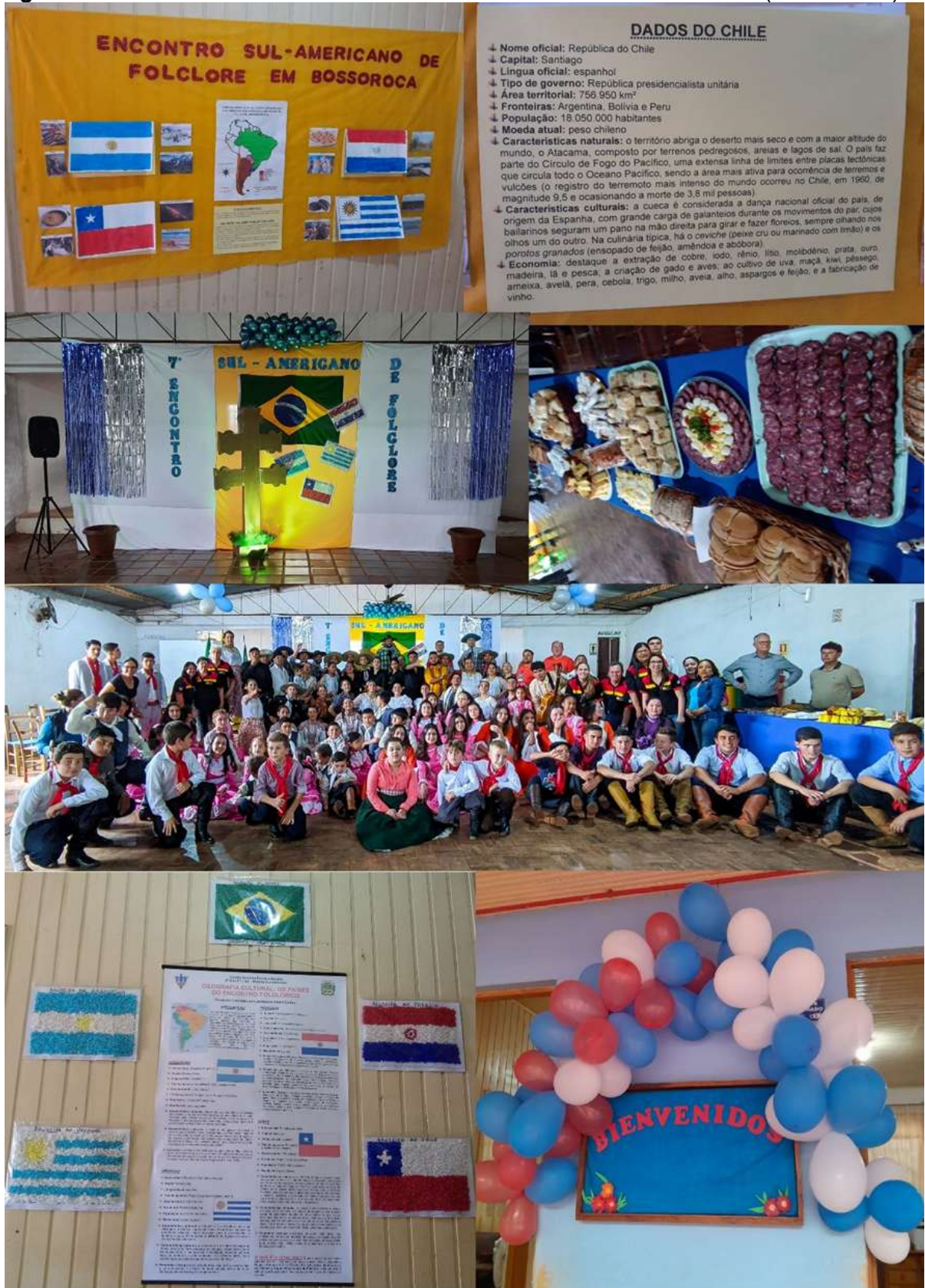
Figura 3 – . Atividades escolares referentes ao evento folclórico em Bossoroca (2022 e 2025).