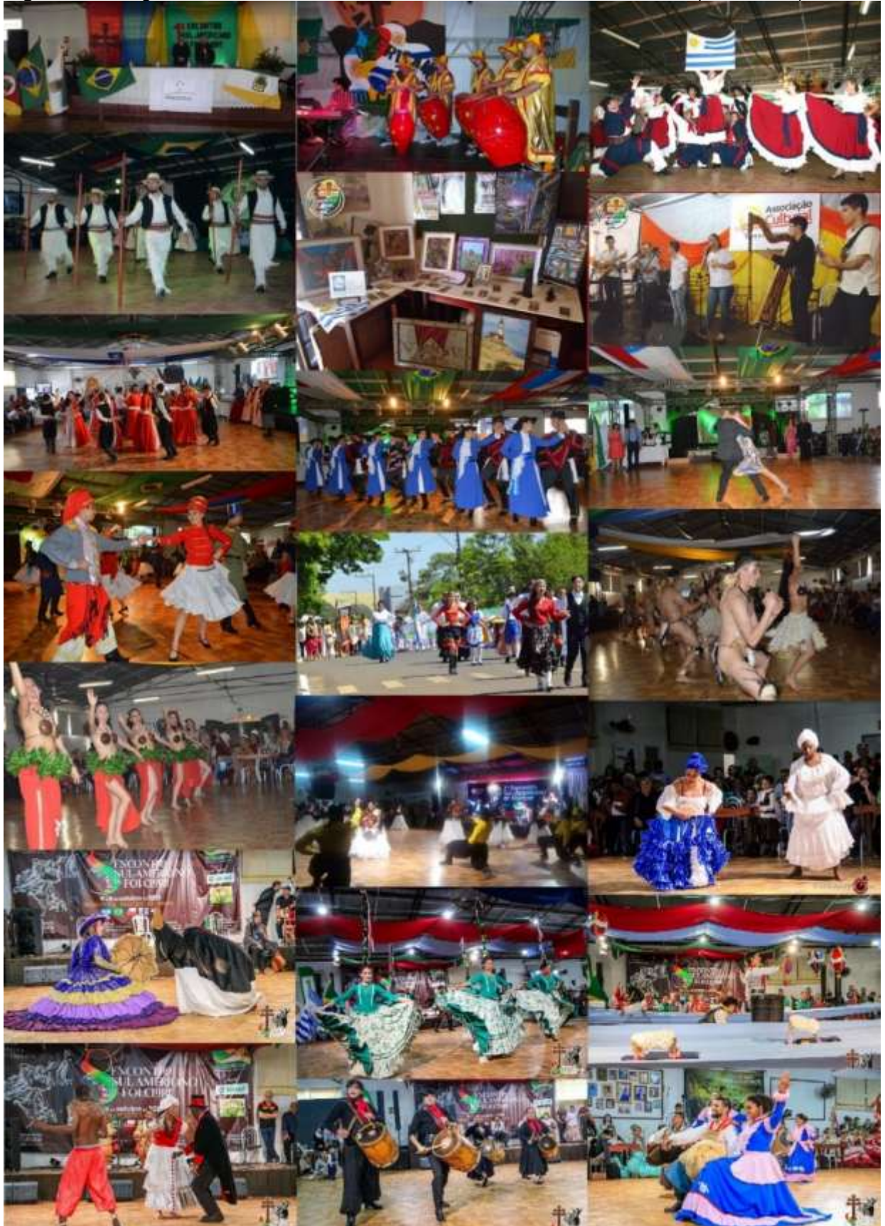
Figura 2 – . Registros do Encontro Sul-Americano de Folclore em Bossoroca (2011-2025).

Fonte: Blog Bossoroca (2011-2019); Kukaexplora Group (2022; 2025).